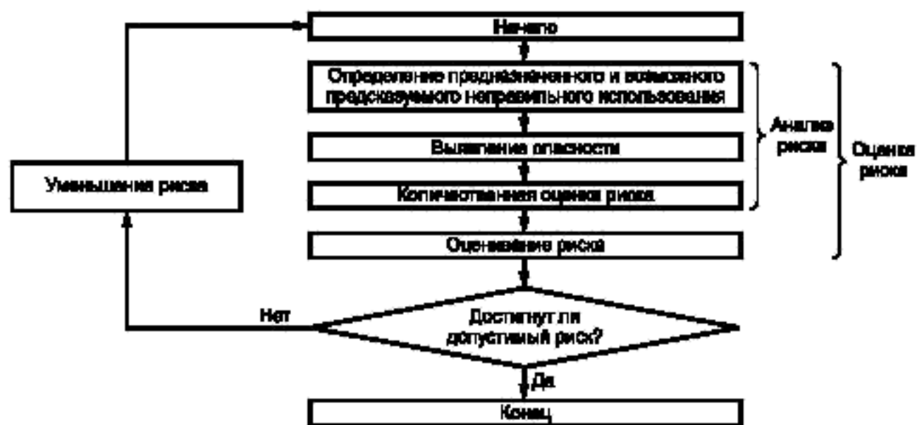
Рисунок 1 — Итеративный процесс оценки риска и уменьшения риска

5.3 Допустимый риск достигают с помощью итеративного процесса оценки риска и уменьшения риска (см. рисунок 1).